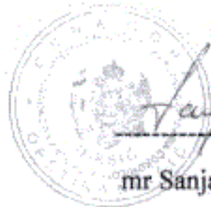
mr Sanja Radulović, direktorica

Potvrda se izdaje na lični zahtjev, a služi radi ostvarivanja prava dopunski rad, te se u druge svrhe ne može upotrijebiti.