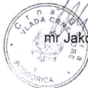
mr Jakov Milatović

PREDSJEDNIK KOMISIJE Ministar ekonomskog razvoja