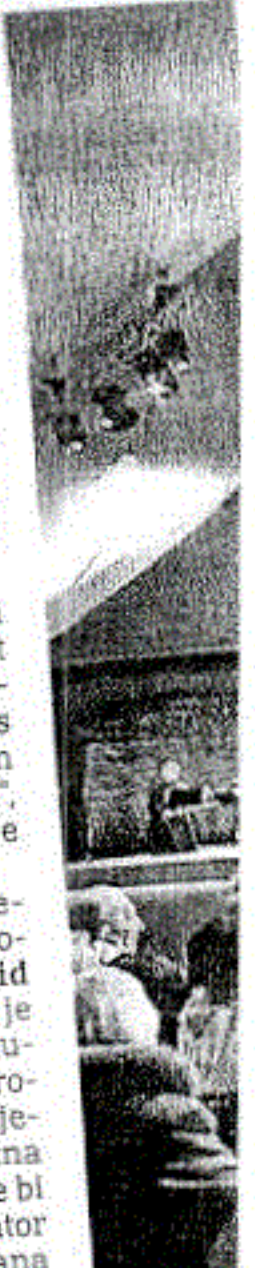
Jevrejsko javno za Jevrejske jeta. Obil prisustv: Njemači Frank V

dice, rekao je da bi voljeli da sledeća generacija zna kroz šta su prošli i da to ne bi smjelo da se ponovi. "Diktator se ne pojavljuje jednog dana već pravi male korake. Ako ne pazimo, jednog dana se probudite i već je kasno", izjavio je Marks. Bi-Bi-Si je organizovao prijem za preživjele i njihove porodice u nedjelju uveče na staroj zatvorenoj tramvajskoj stanici u krakovskom