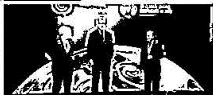
Đukanović stigao u Glasgow na Samit svjetskih lidera