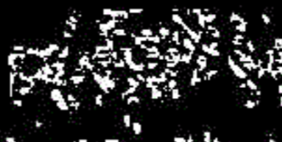
Meksikanci slave Montereju pripala peta titula Uge Sampsona