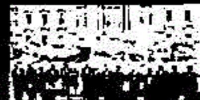
Svjetsku četnic zbog suesjeria izazvali saobraćajni kolaps u Rimu